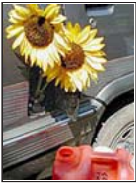
Running on Top Soil