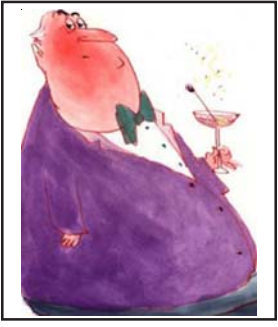
DDHH Estados Unidos pág.12